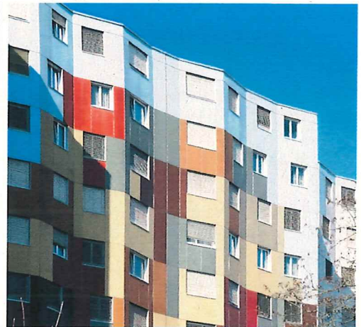
Giulia Marino EPFL/TSAM

Avanchet-Parc a été construit dans les années 70 dans la lignée des HLM et des déclassements de zone agricole pour remédier à la pénurie de logements. La réalisation d'un véritable quartier avec 2240 appartements pouvant accueillir quelque 7000 habitants revient aux promoteurs alémani-